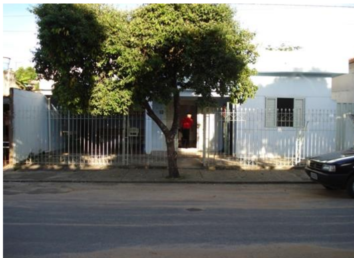
FIGURA 1 – Sede da ESF Vila Gontijo/Esplanada

A caracterização da UBS em relação ao padrão mínimo determinado pela resolução SES nº1186 é inadequada. A UBS é composta por dois consultórios, uma sala para realização de curativo, preparo de material para esterilização e retirada de pontos, uma sala de vacina, e um corredor que foi adaptado para a administração de medicamento, inalação e lavagem de material contaminado. Não existe sala para recepção dos pacientes. Existe uma cozinha grande que funciona também como a sala dos ACS e para reunião de equipe. As reuniões com a comunidade são realizadas no salão comunitário que se localiza em frente à UBS.